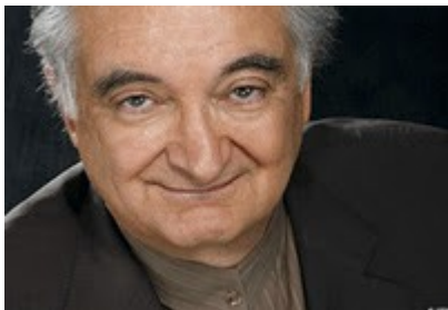
(Jacques Attali, à esquerda)

3. Hiperdemocracia (2060) = esgotada pelas guerras e convulsões sociais, a opinião pública mundial vai acolher de braços abertos "a criação de um governo democrático mundial". Será um sistema colectivista, com todos a trabalhar para o "bem comum". Eu selecionei alguns temas para dar-lhe um sabor do livro. (Oh sim, que bom, um Estado Cibernético Totalitário Mundial, cheio de escravos, controlados até ao mais ínfimo detalhe, vejamos algumas das ferramentas que estão e continuarão a usar)